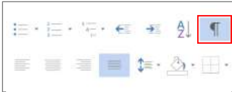
Abbildung 1: Absatzmarken anzeigen lassen

Vor der Nutzung dieser Formatvorlage empfehlen wir Ihnen, die Absatzmarken durch Word darstellen zu lassen, um u. a. auch die Seitenumbrüche zu erkennen, deren Positionierung insbesondere für die Kopfzeilendarstellung und die Nummerierung der Seiten vonnöten ist.